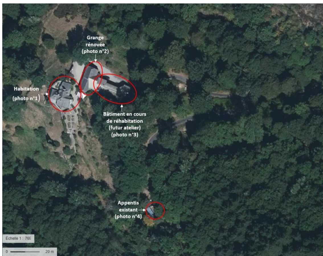
Visualisation des bâtiments existants

Deux bâtis cadastrés ne sont plus visibles sur les lieux.