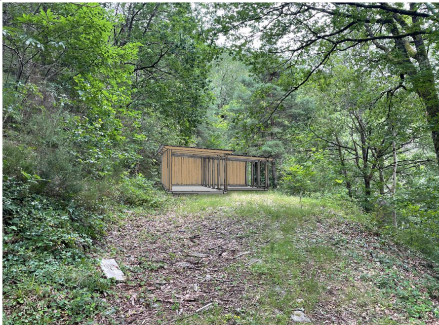
Insertion du projet dans son environnement