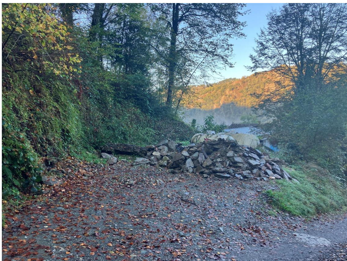
Site du projet n°2 : aire de stockage