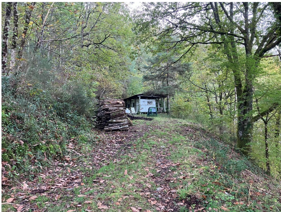
Site du projet n°1 : appentis en bois existant