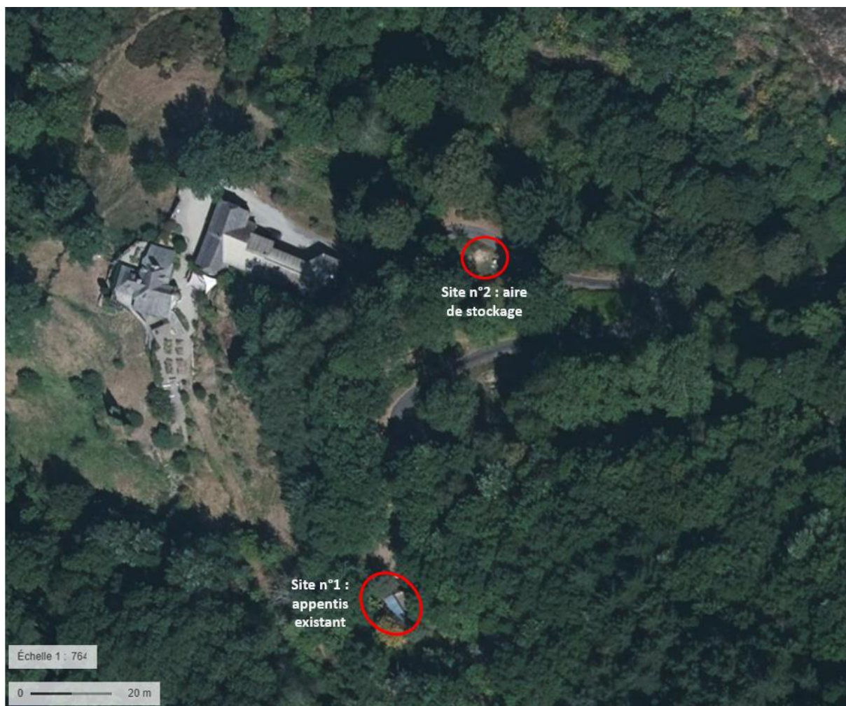
Localisation des sites